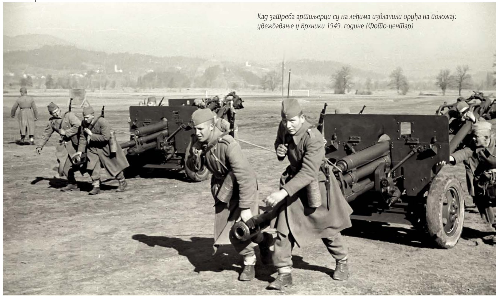
Како зашреба артиљерци су на леђима извлачили оруђа на положеј: увјежбавање у Врхники 1949. године

После пренаоружања Југословенске армије са додатним количинама „зисова“, они су постали најзаступљеније оруђе артиљерије. У саставу батерија, у