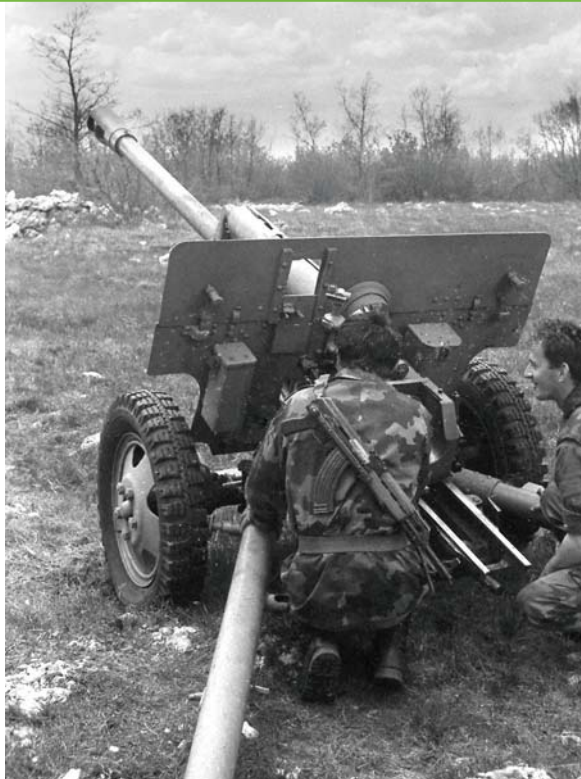
У грађанском рату „зис“ се, и поред застарелости, ипак улази у ваљану употребу: Лика маја 1993. године (В. Кадијевић)

вог малоротирајућег кумулативног пројектила.