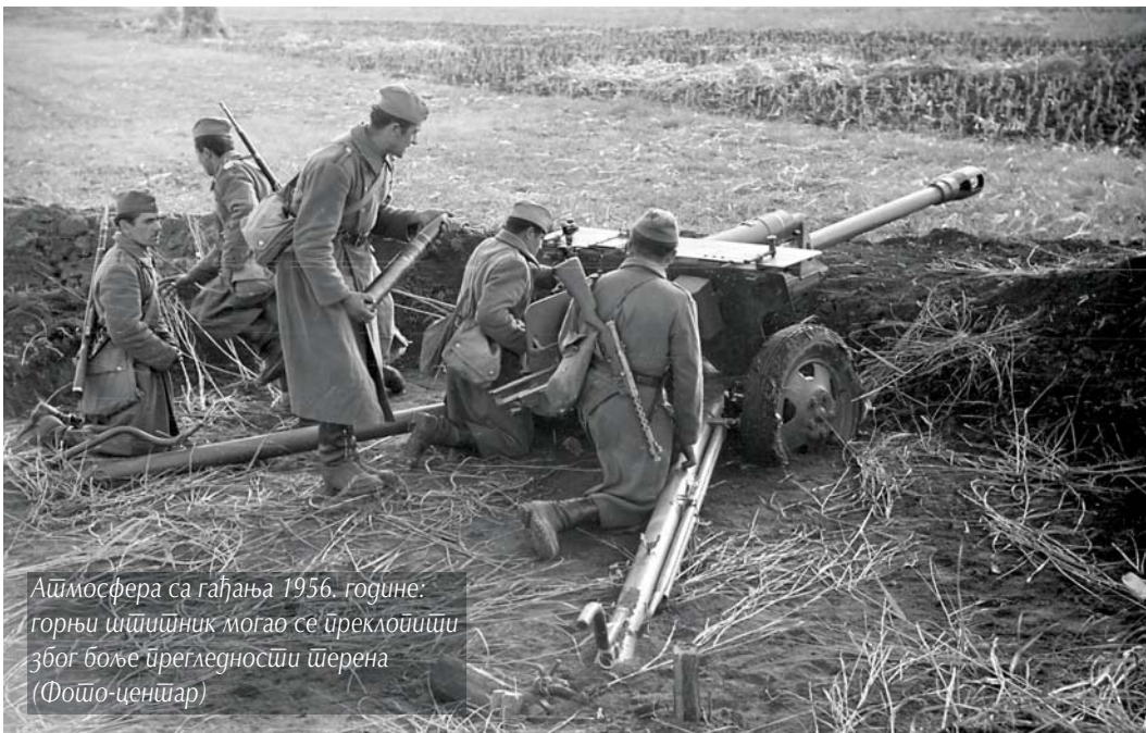
Атмосфера са гађања 1956. године: горњи штићеник могао се преклопити због боље прегледности шперена

Муниција предвиђена за топ М42 користила се и за топ Д-56ТС на лакој амфибијској тенку ПТ-76Б. Поред тога, „зисови“ су могли да гађају са муницијом намењеном за брдски топ домаће производње М48Б1 и пуковски топ М27, произведен у СССР-у, али само као смањено пуњење. За разлику од „зиса“ који је могао да користи „туђу“ муницију, друга оруђа калибра 76 mm нису смела да користе метке предвиђене за М42.