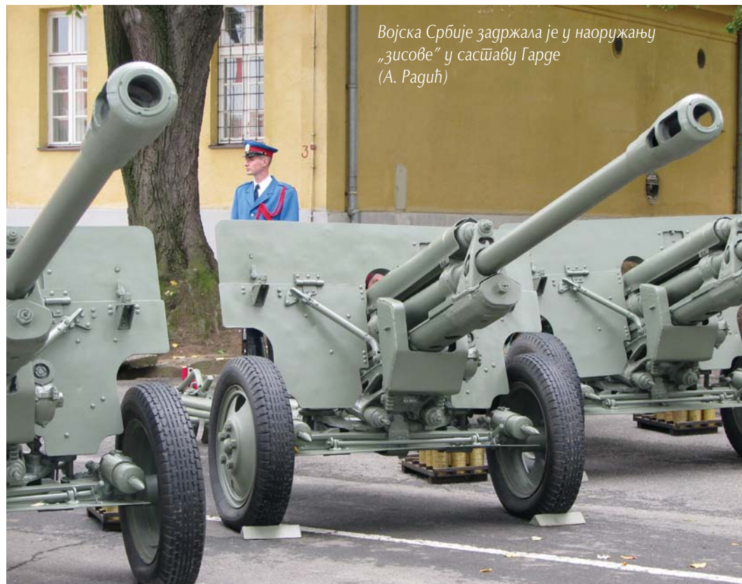
Војска Србије задржала је у наоружању „зисове“ у саставу Гарде (А. Рагућ)