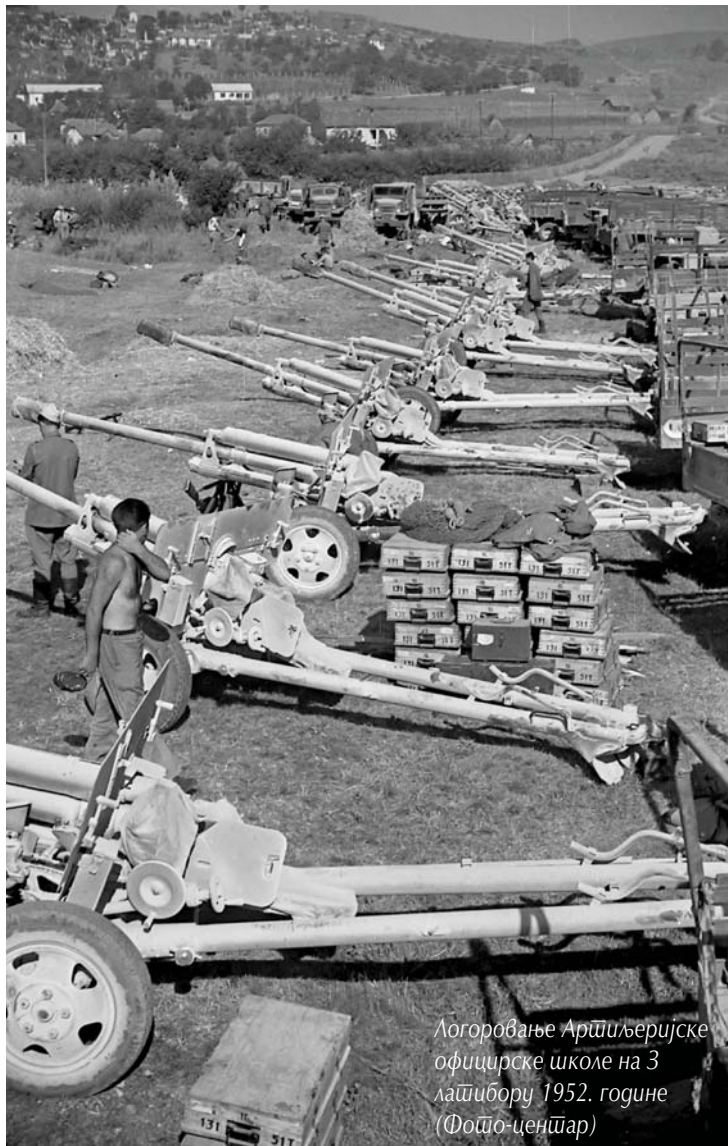
Логоровање Артиљеријске официрске школе на Златибору 1952. године

У Босни априла 1945. водиле су се тешке борбе, у којима је 2. армија у својој армијској артиљеријској групи имала две бате-