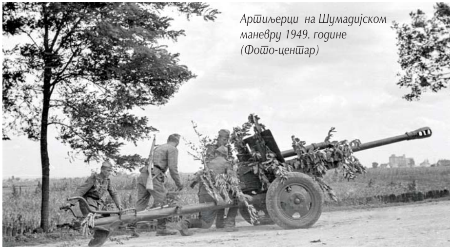
Артиљерци на Шумадијском маневру 1949. године

боље наоружаним стрељачким дивизијама била су четири оруђа са моторном вучом, а у делу стрељачких дивизија и у брдским дивизијама са коњском вучом. Према формацији, стрељачке дивизије прве варијанте имале су артиљеријску бригаду у којој су била по два дивизиона од 12 оруђа 76 mm и хаубички дивизион 122 mm М38 или 105 mm М18 од осам оруђа. Још 12 „зисова“ било је у противтенковском ловачком дивизиону. У саставу 17 стрељачких дивизија друге варијанте налазио се мешовити дивизион са хаубицама и са две батерије 76 mm,