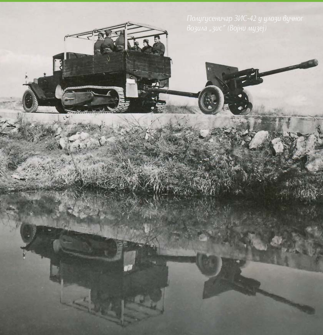
Полугусеничар ЗИС-42 у улози вучног возила „зис“

Артиљеријска припрема почела је у 8 h и планирано је да се заврши у 10 h, када је требао да почне јуриш пешадије. У првом сату требало је да се обави коректура, потом би уследило 45 минута дејства по живој сили и ватреним положајима на предњем крају и ближој дубини, да би у последњих 15 минута, пре јуриша, била остварена концентрична ватра на предњи крај. Пешадија је закаснила са покретом, а артиљерија је пренела ватру по дубини, па су Немци и Хрвати одбацили покушај пробоја. Наредног дана одбрана противника пробијена је после кратке, али боље организоване артиљеријске припреме. Прогон пораженог противника зауставио се на Дунаву, у поплавленим Босутским шумама. Борбе су настављене и партизански артиљерци су овладали „зисовима“.